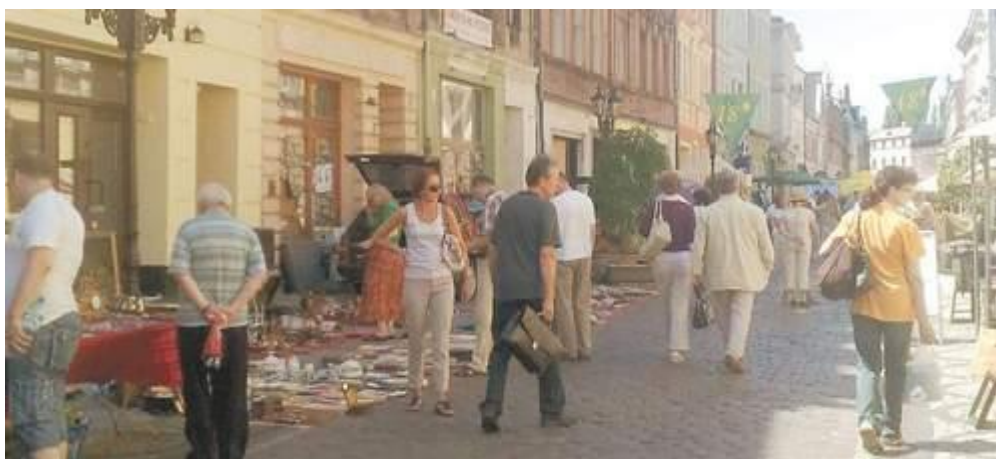
Jarmark Antyków i Osobliwości , ul. Długa - Bydgoszcz