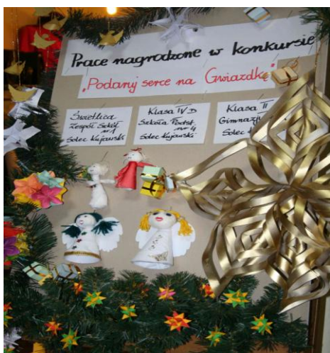
wystawa prac nagrodzonych w sklepie charytatywnym Sue Ryder w Bydgoszczy