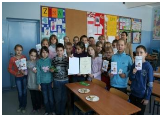
wręczenie nagród SP nr 4 w Solcu Kuj.