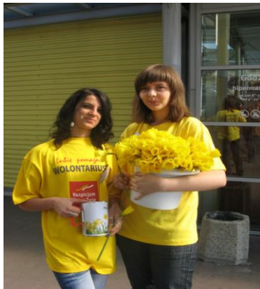
wolontariuszki podczas akcji

ludzie rozdali 5500 żonkili będących symbolem nadziei. Zebrali łącznie 6820,63 złotych z przeznaczeniem na sprzęt rehabilitacyjny, materiały do terapii logopedycznej, środki higieniczne, turnusy rehabilitacyjne oraz zorganizowanie Dnia Dziecka dla pacjentów Hospicjum Domowego dla Dzieci Domu Sue Ryder w Bydgoszczy i ich rodzin. Sprawozdanie z akcji zostało opublikowane na łamach lokalnej prasy.